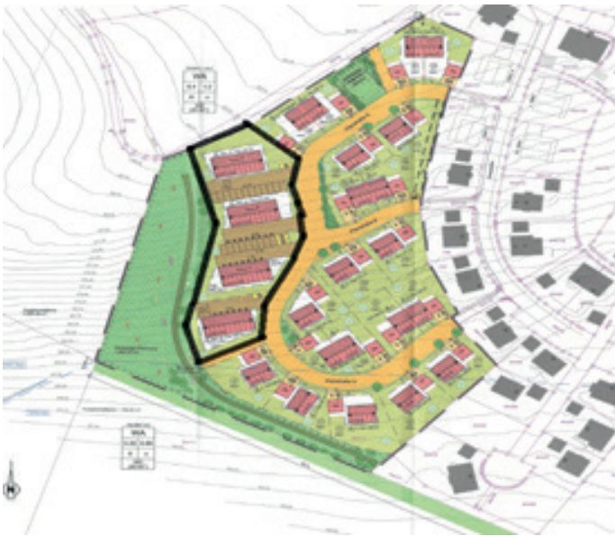
Auszug Bebauungsplan; verkleinerte Darstellung ohne Maßstab; Bearbeitung Markt Lappersdorf

Das Plangebiet umfasst eine Gesamtfläche von ca. 0,35 ha. Mit der Änderung des Bebauungsplanes verfolgt der Markt Lappersdorf eine geänderte städtebauliche Konzeption. Die bisher für den Bereich der Mehrfamilienhäuser festgesetzten oberirdischen Stellplätze sollen in Tiefgaragen zur Verfügung gestellt werden. Verbunden damit ist die Änderung der Darstellung der privaten Straßenverkehrsflächen und der Grundstückszufahrten. Durch die Festsetzung von Tiefgaragen soll die Aufenthaltsqualität für die Bewohner der Mehrfamilienhäuser durch Anlage von größeren Grün- und Freiflächen verbessert werden. Als weiteres Ziel wird eine CO 2 -freie Deckung des Wärmebedarfs (Erzeugung und Nutzung erneuerbarer Energien, wie z.B. Solarthermie) angestrebt.