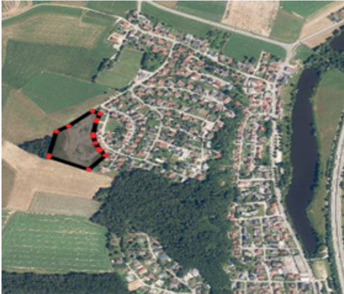
Auszug Lageplan; verkleinerte Darstellung ohne Maßstab; Bearbeitung Markt Lappersdorf